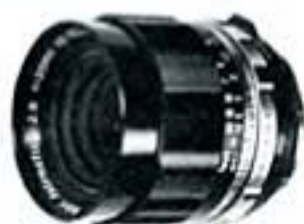
ペトリ35 F 2.8

広角レンズの特長は、写角の広いことで、狭い場所でも広い範囲を写すときに便利です。つぎに被写界深度が深いので全体にピントが合います。スナップなどに便利です。ペトリ35ミリレンズは自動絞りなので、ピントは開放で合わせて、シャッターを切る瞬間だけ所定の絞りまで絞り込まれるので、こうしたスナップ撮影には特に便利なレンズといえます。