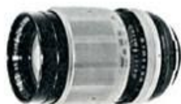
ペトリ135 F 3.5

135ミリレンズはアマチュアにも使いやすい望遠レンズです。近づけないものを大きく写すことはもちろんのこと、ボケを活用すると美しいポートレートが写せます。ペトリ135ミリレンズは開放でも鮮鋭なピントを結び、その描写力には定評があります。 完全自動絞りとプリセット絞りの両方がありますが、レンズの描写力は変わりありません。