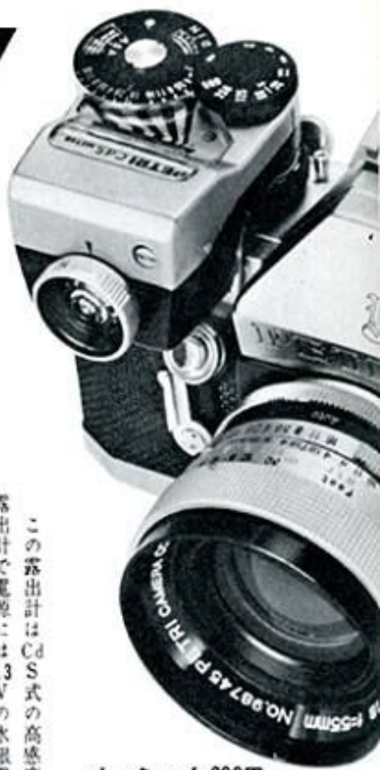
メーター 4,600円 (ケース付)

この露出計はCdS式の高感度露出計で電源には1.3Vの水銀電池を使用します。ASA 100フィルムではLV2-LV18に連動し、ASA目盛は6-3、200(DIN目盛9-36)です。この露出計を取付けると、露光に関する心配は全く解消して写せます。