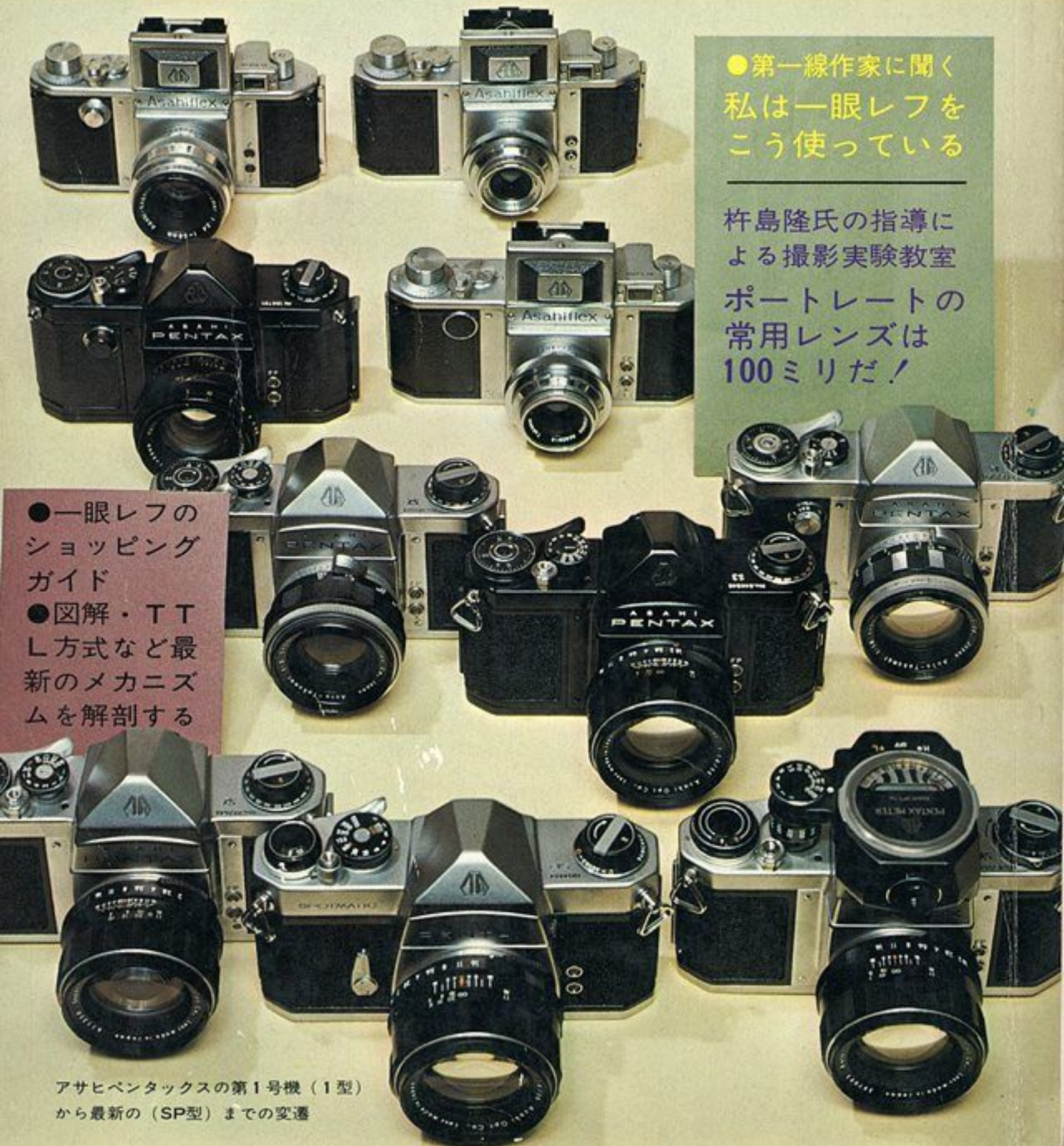
アサヒペンタックスの第1号機（1型） から最新の（SP型）までの変遷

●一眼レフの ショッピング ガイド ●図解・TTL 方式など最新 のメカニズ ムを解剖する