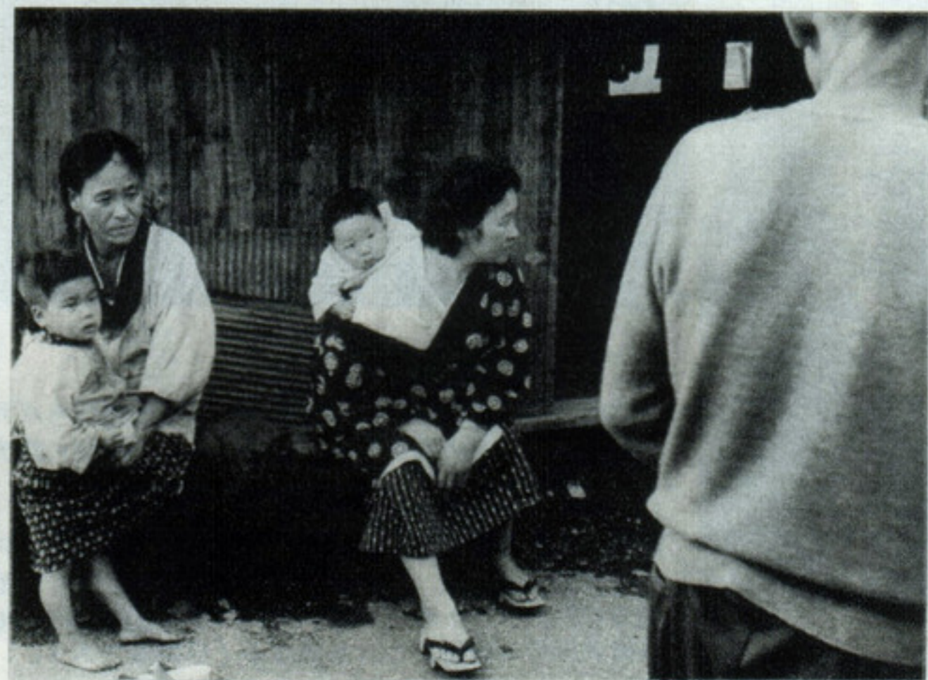
ワイド 35ミリ F3.5 絞8 1/25秒 コニパンSS マイクロフエン 吉野FS3 コントーン