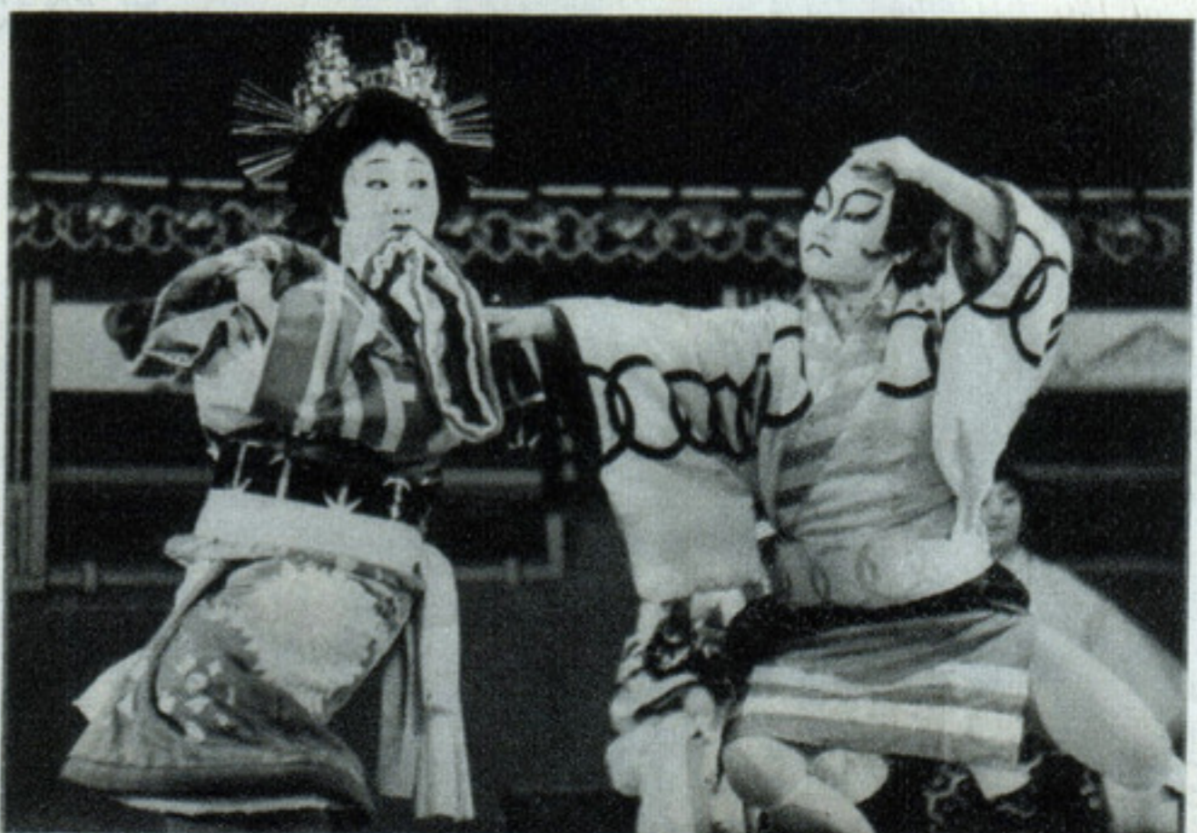
テレ 105ミリ F3.5 絞4 1/60秒 コニパンSSS マイクロフエン 吉野FS2 コントーン