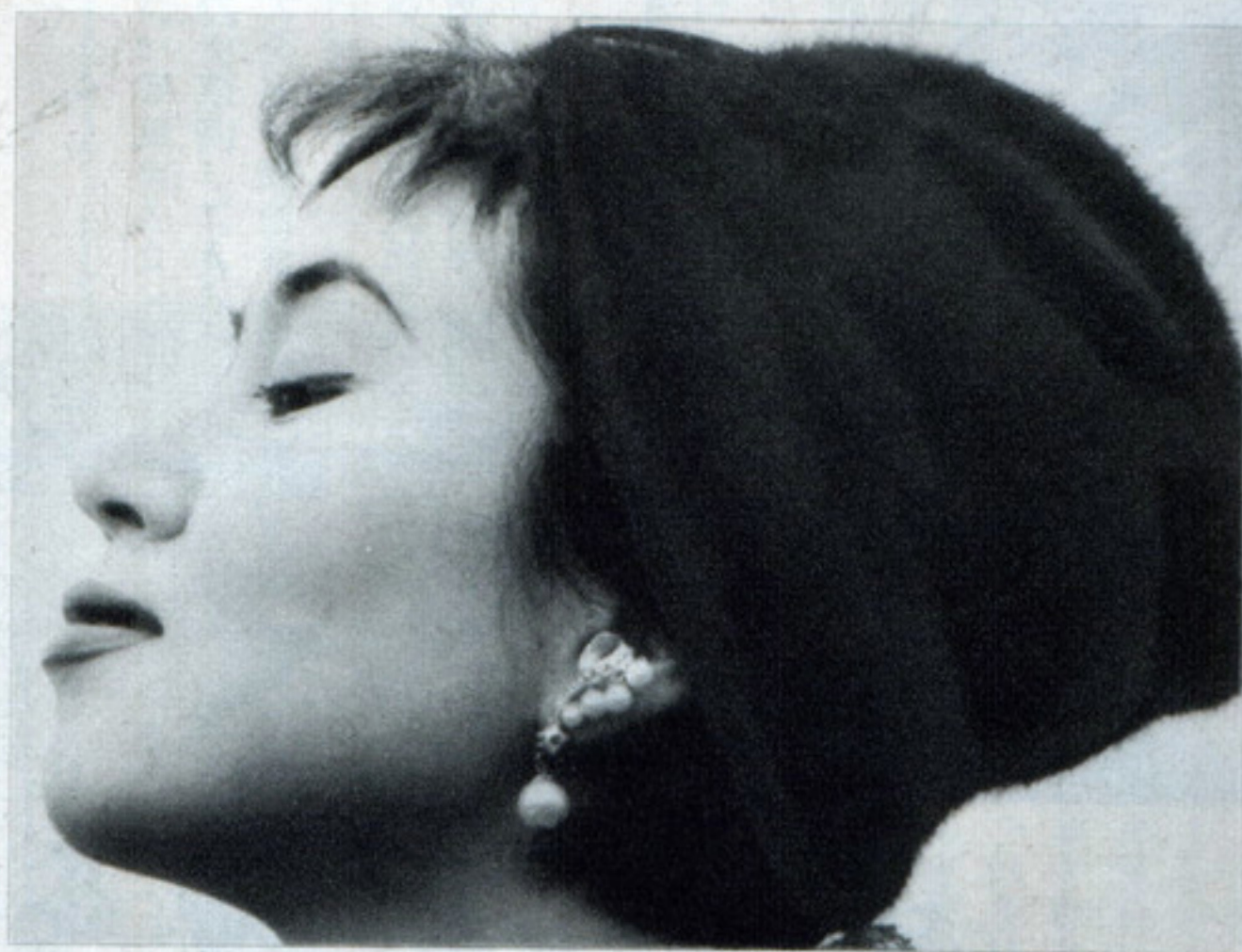
テレ 135ミリ F8.5 絞22 1/2秒 コニパンSS マイクロフエン 吉野FS3 コントーン