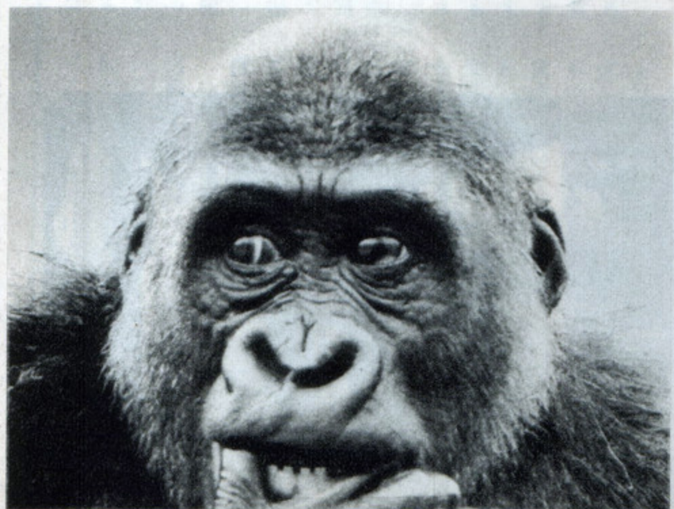
スーパーテレ 500ミリ F8 絞開放 1/60秒 コニパンSS マイクロフエン 吉野FS3 コントーン