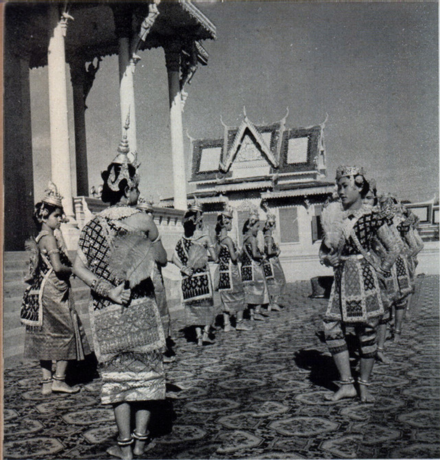
カンボジア王国宮廷舞踊団の踊り