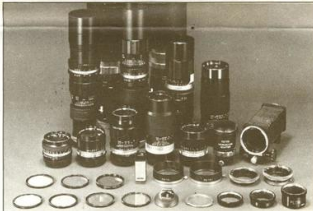
ミニフラッシュガン フード フィルター